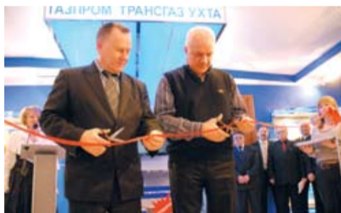
Открытие именной рекреации «Газпром трансгаз Ухта»