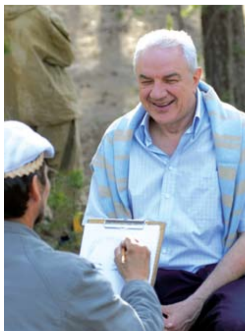
Штрихи к портрету.