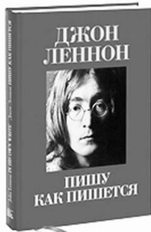
Джон Леннон «ПИШУ КАК ПИШЕТСЯ»