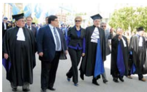
Праздничная колонна УГТУ в День выпускника.