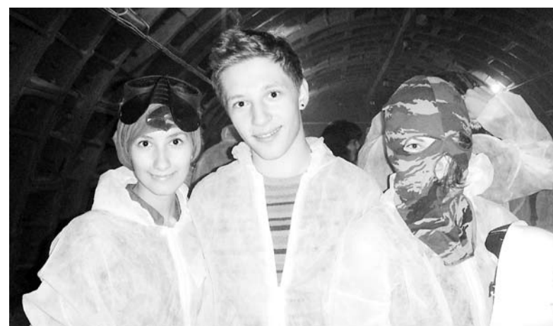
В рассекреченном бункере после игры «Антитеррор».

Ребята, вы все можете, можете сами изучать технологии, применить их другим; стать известными людьми в больших компаниях, взаимодействовать с ними и сделать лучше себе, родному вузу да и в какой-то мере стране... Находите единомышленников, программы, конференции, участвуйте во всем, не боясь, быть может, показаться смешными. И начинайте как можно раньше. И тогда у вас обязательно все получится!