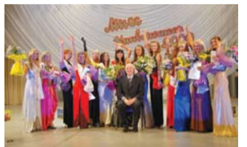
Конкурс «Мисс университет»