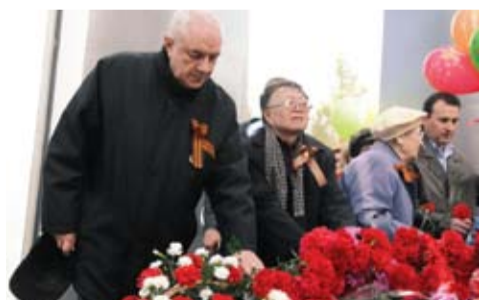
9 мая. Возложение цветов к Вечному огню.