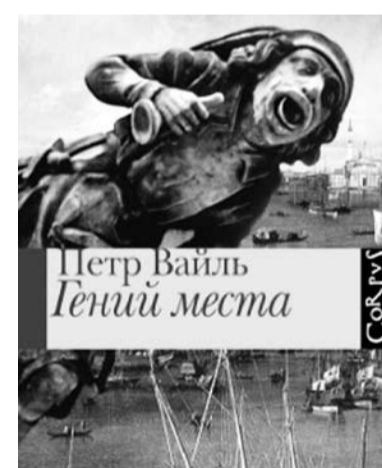
Петр Вайль «ГЕНИЙ МЕСТА»

Сновидческая гротескность и одновременно большая человеческая нежность к своим героям и к читателю напоминают кудесника Нила Геймана и не посрамят ожиданий тех, кто уже знаком с двумя первыми книгами Линк.