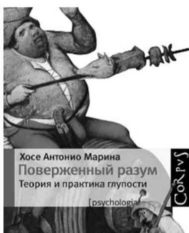
Хосе Антонио Марина «ПОВЕРЖЕННЫЙ РАЗУМ. ТЕОРИЯ И ПРАКТИКА ГЛУПОСТИ»