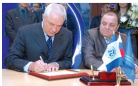
Открытие именных аудиторий СМН.