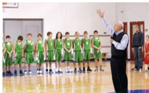
Открытие баскетбольного сезона-2010.