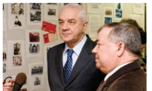
На 90-летию комсомольской организации.