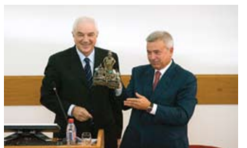
Визит президента компании «ЛУКОЙЛ» Вагита Алекперова.