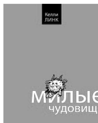
Келли Линк «МИЛЫЕ ЧУДОВИЩА»

В этом году 70 лет со дня рождения Джона и 30 лет со дня его смерти. Две круглые даты — достойный повод воскресить замечательную книгу.