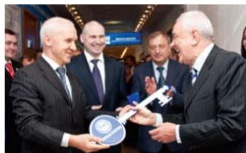
Открытие именных аудиторий «АК «Транснефть»