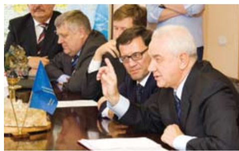
Встреча с представителями компании ЛУКОЙЛ.