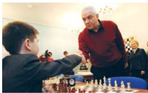
Открытие шахматного клуба в УГТУ