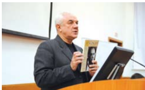
Презентация журнала «Концепт».