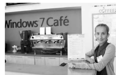
По всему офису расставлены автоматы с бесплатным кофе, а внизу есть Windows 7 Cafe (название меняется с выходом новой версии операционной системы)

Это мероприятие было совершенно другим, нежели чем все, на которых я бывала ранее. Обычно ты приезжаешь на конференцию, форум... Там пользуются твоими мозгами, идеями, говорят «спасибо» и прощаются с тобой. Да, интересно пообщаться с единомышленника-