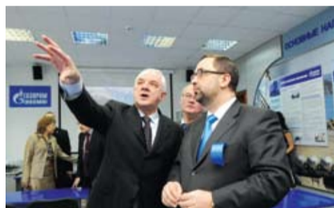
Встреча с представителями «Газпрома»