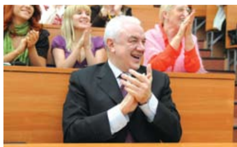
На праздничном концерте в честь 8 Марта.