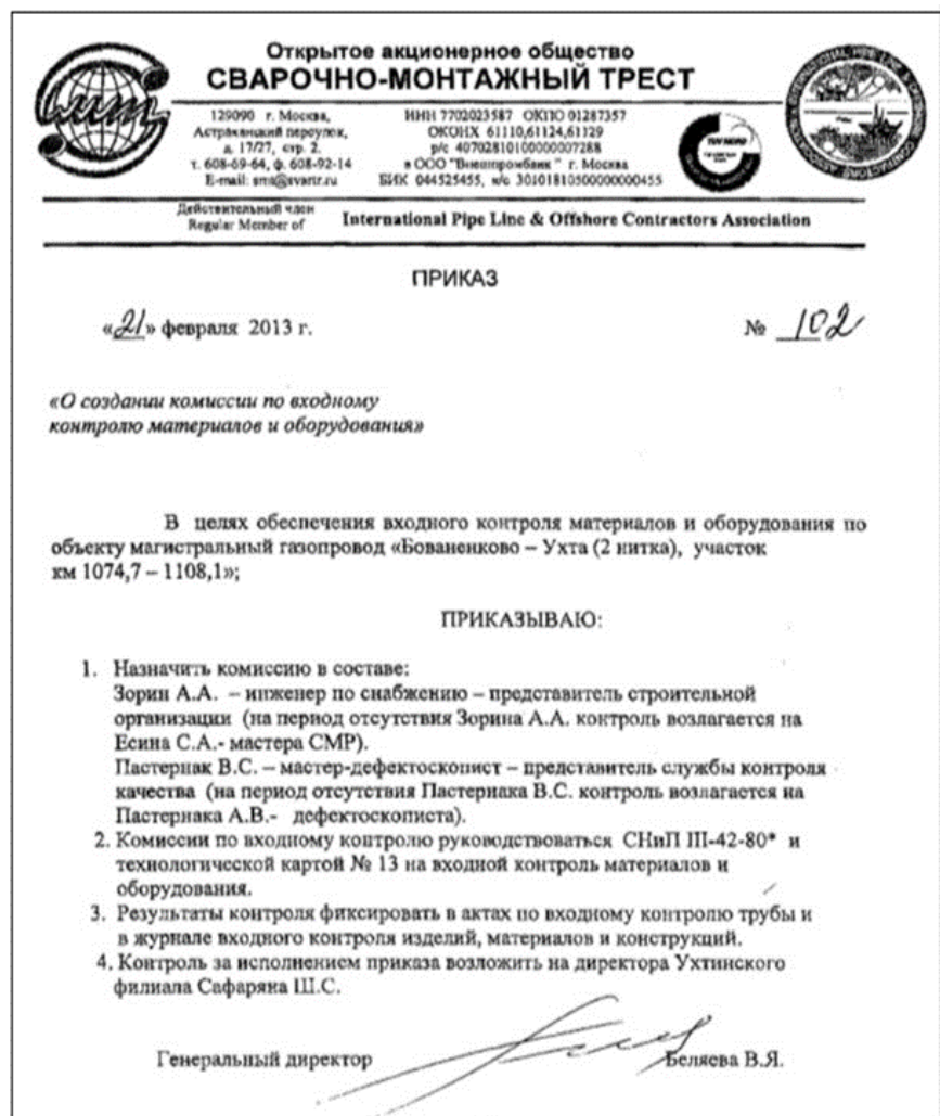
Рисунок 1.4 – Приказ о создании комиссии по входному контролю

Генеральным директором создается приказ о создании комиссии по входному контролю материалов и оборудования, в целях фиксирования и контроля поставки оборудования – приказ о создании комиссии по входному контролю (рис. 1.4).