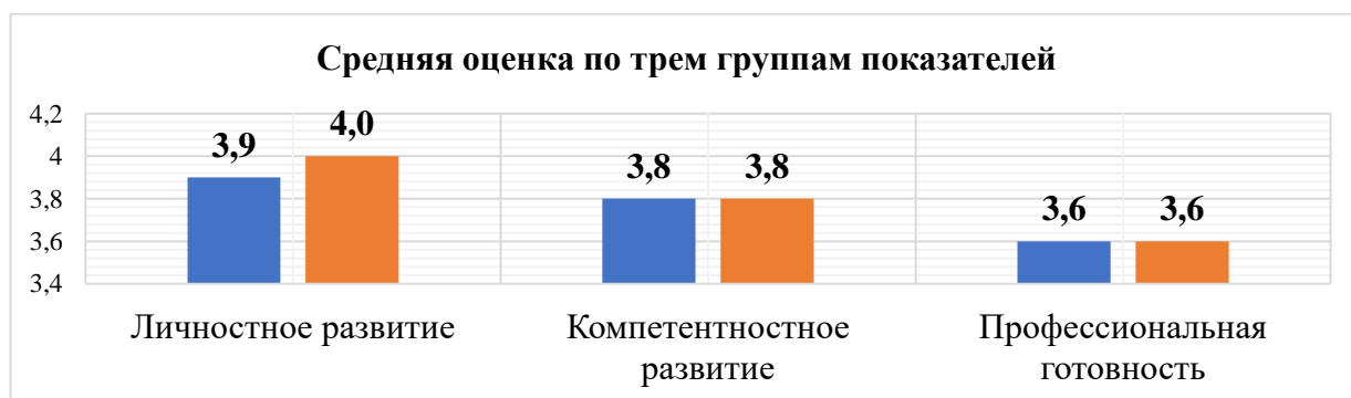
Рис. 1. Средняя оценка по группам показателей

Далее рассмотрим три группы показателей (рис 1, 2), синим выделены результаты 2018 года, оранжевым – 2022.