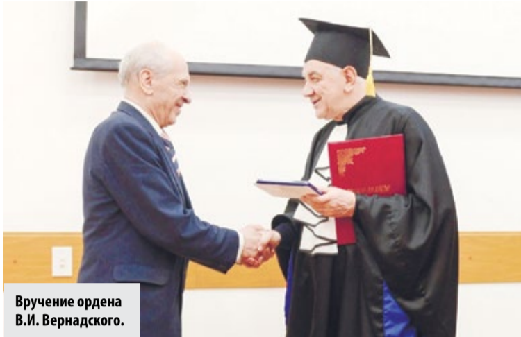
Вручение ордена В.И. Вернадского.