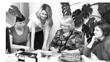
Рабочие будни Центра по профориентационной работе УГТУ.

«В ходе семинара мы провели деловую игру, — говорит Лилия