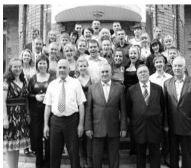
Лесотехнический факультет УГТУ по праву отмечает Всероссийский День лесника как свой профессиональный праздник.

К «легким планеты» под названием лес факультет причастен своим появлением в составе вновь созданного вуза, своими достижениями и своей стойкостью. Он не был профильным изначально, но крайне необходим для решения своих специфических задач.