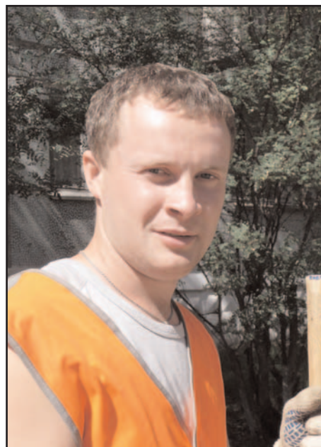
Боец отряда "Ударник" во время работы

Сейчас необходимо создать единую систему всех студенческих отрядов. Надеюсь, что республиканский штаб студенческих отрядов войдет во Всероссийскую общественную организацию штаба студенческих отрядов, и будет иметь возможность участвовать в образовательных семинарах, а также выезжать работать за пределы Республики Коми. Думаю, что со временем у нас появятся и медицинский студенческий отряд, и отряд студентов-экологов и много других не только рабочих специальностей удастся охватить.