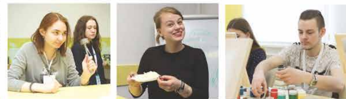
Кулинарный мастер-класс «Как приготовить завтрак за 5 минут, обед — за 10 и ужин — за 7 без «Доширака».