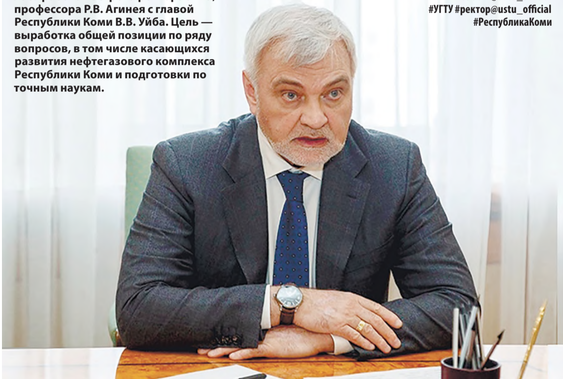
#новости@ustu_official #УГТУ #ректор@ustu_official #РеспубликаКоми